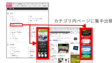
記事面ハイケージャック出稿例

<カテゴリの例> 菓子、飲料、アルコール、ファストフード、コンビニ、テイクアウト、地域…etc