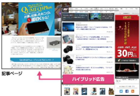
TOP/バックナンバーなど

ご希望に応じたカスタムデザインでのページ制作が可能なタイアップ記事です。自由なレイアウト、印象的なヘッダーイメージ、制限のないページ内バナー掲出など、貴社サイトへの誘導などを強化する仕組みを実現できます。