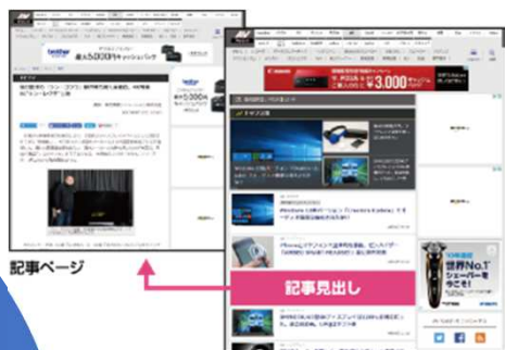
TOP/バックナンバーなど

記事、誘導ともに通常の記事とほぼ同様の見え方となるタイアップ記事です。読者が日頃親しんでいる記事デザインを通じて、自然な商材訴求が可能となります。