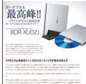
スペシャルサイト風